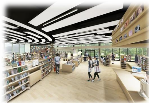
※新図書館の イメージ

鳥取県立図書館のビジネス支援サービスを担当。起業・経営に必要な情報を調査・日々提供している。