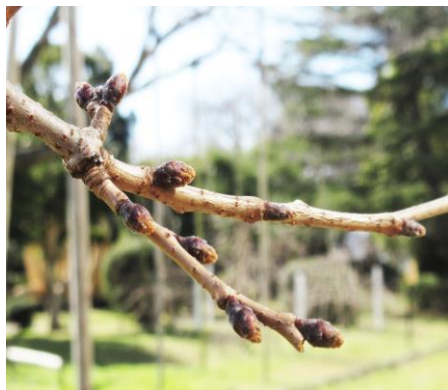
(境中央公園の桜のつぼみ)